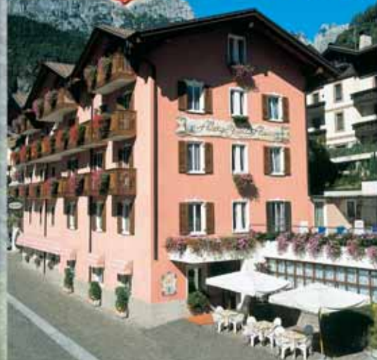
Lago di Molveno - Trentino